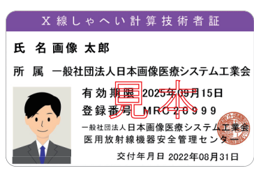
X線しゃへい計算技術者資格証

認定試験の合格者に対して、JIRAより「X線しゃへい計算技術者」の資格証、認定証が送付されます。